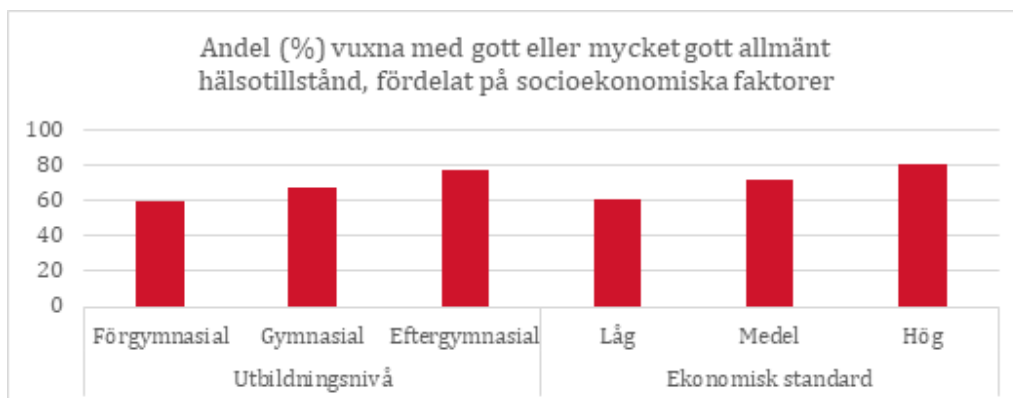
Figur 1. Allmänt hälsotillstånd bland vuxna, fördelat på utbildningsnivå och ekonomisk standard.

Vidare anger sju av tio (68 %) vuxna att de har ett bra eller mycket bra hälsotillstånd. Lägst andel vuxna som mår bra eller mycket bra återfinns i Surahammar och Skinnskatteberg medan Västerås har högst andel. Samtidigt som det inom Västerås stad finns betydande skillnader mellan stadsdelarna. För unga är det särskilt Skinnskatteberg som utmärker sig eftersom unga där mår signifikant sämre än i andra delar av länet.